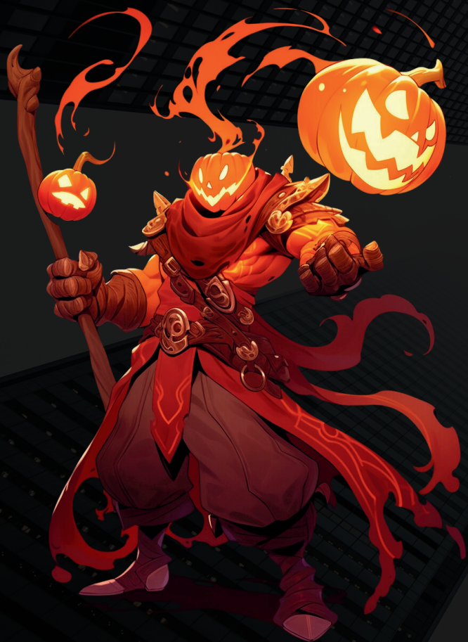
#10. カボチャゴースト