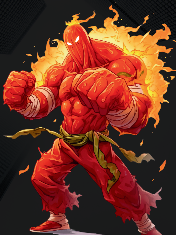
#11. レッド・ホット・チリ・ペッパー