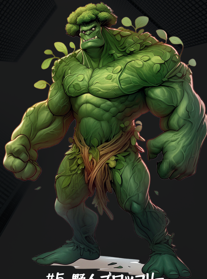
#5. 野人ブロッコリー