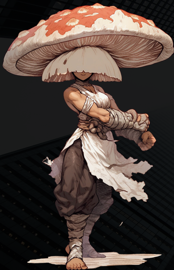
#4. カンフーシイタケ